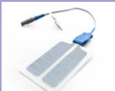
Piastre adesive monouso