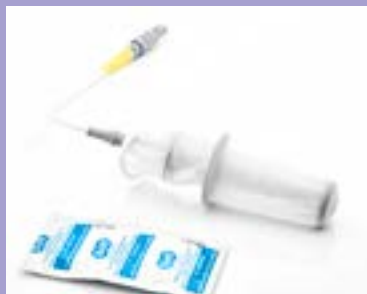
Piastre adesive monouso